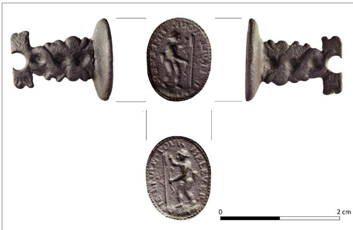
Ryc. 2. Nowożytna pieczęć znaleziona na stanowisku V w Brudnicach (fot. M. Bogacki).