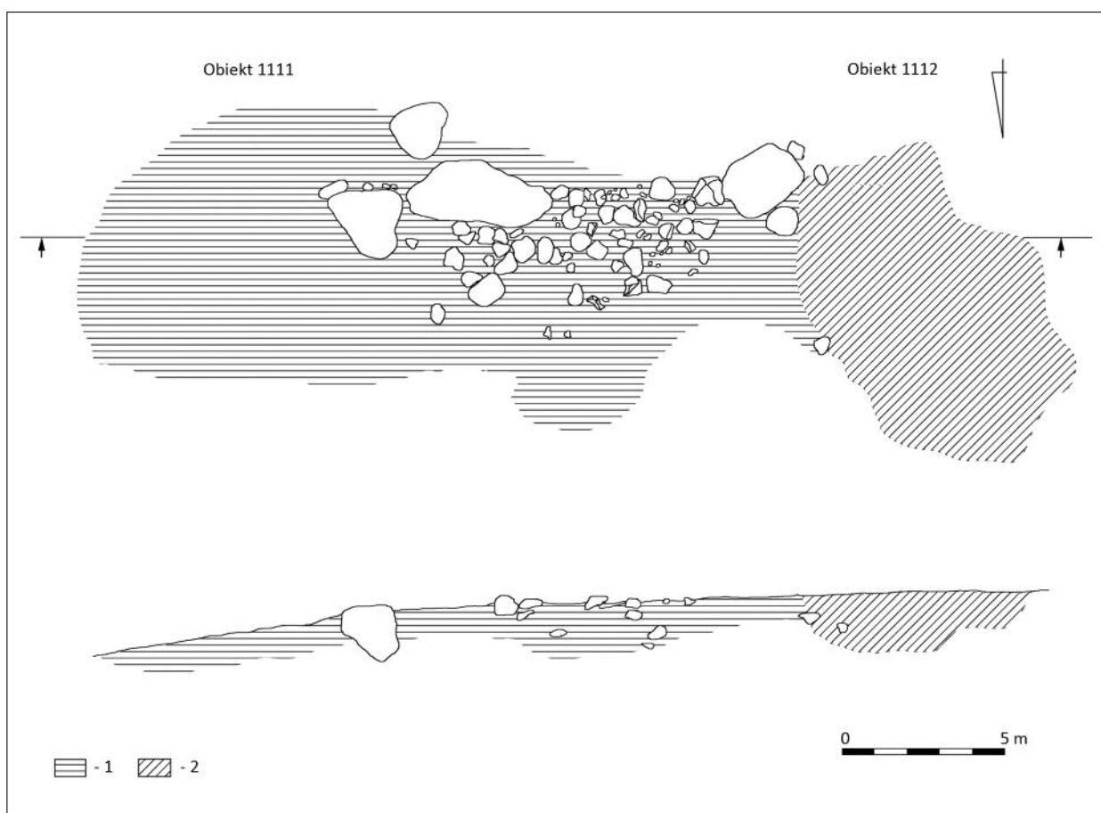
Ryc. 1. Plan i profil obiektów 1111 i 1112: 1 – warstwa brunatna; 2 – warstwa ciemnobrunatna (rys. A. Szela).