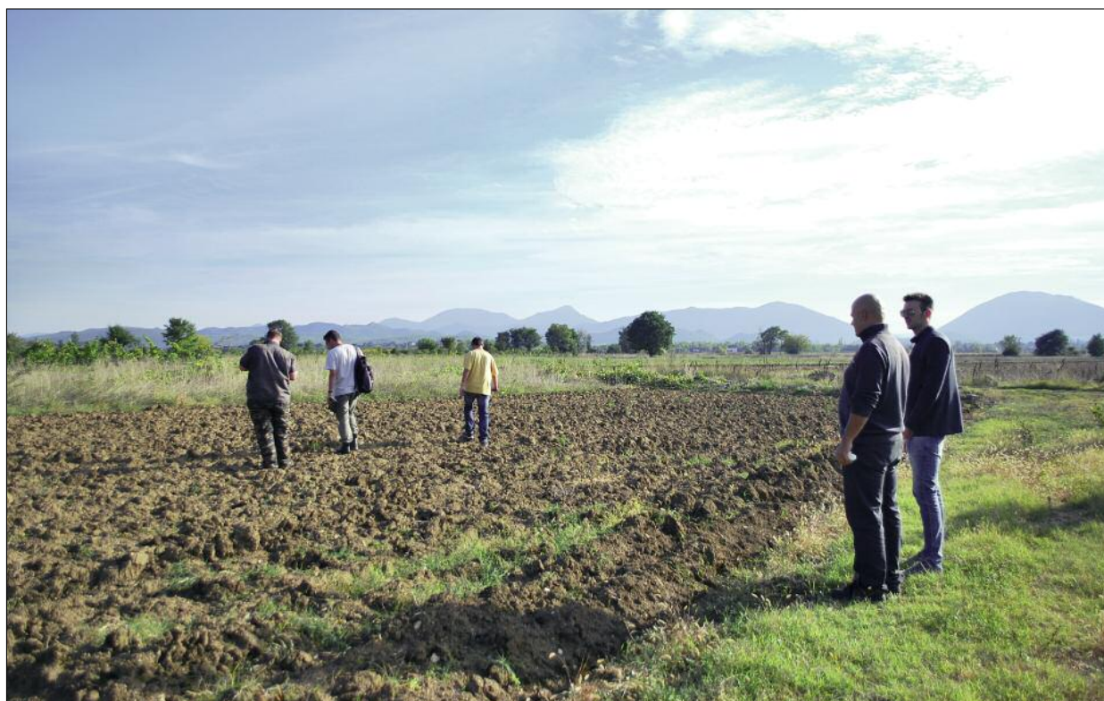
Fig. 3. Dračevica site in Donji Radišići-Sadine (Table 1, no. 14). Determining the size and extent of the archaeological site.

Ryc. 3. Stanowisko Dračevica w Donji Radišići-Sadine (Tab. 1 nr 14). Określanie wielkości i zasięgu stanowiska archeologicznego.