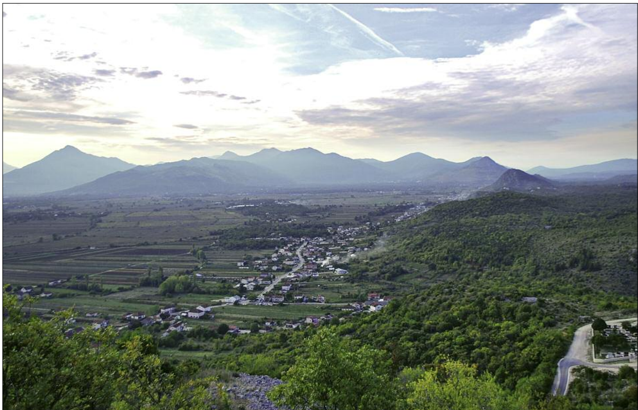
Fig. 1. An overview of the landscape in the Ljubuški community, with the Trebižat River valley flanked by hills and mountains to the southwest and highlands to the north.

The Ljubuški Archaeological Project was designed to collect the available data on the Roman and Late Antique settlement in the valley of the Trebižat River and the surrounding highlands ( Fig. 1 ) comprising the modern