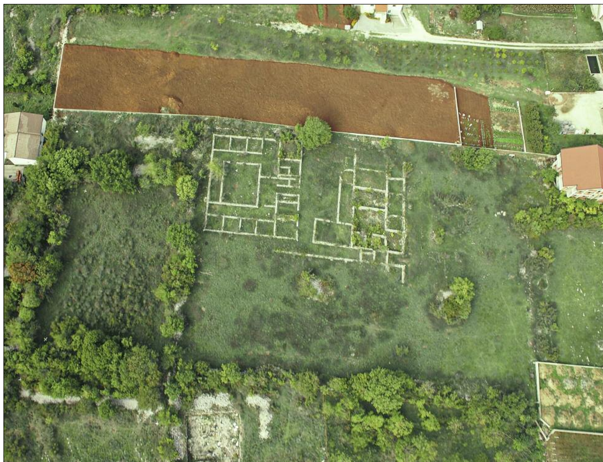
Fig. 2. Aerial view of the Gračine site (Table 1, no. 23) with the architectural remains excavated in the 1970s and 80s. Ryc. 2. Zdjęcie lotnicze stanowiska Gračine (Tab. 1 nr 23) z odsłoniętymi w latach siedemdziesiątych i osiemdziesiątych pozostałościami architektury.

The study of the antique heritage of this region began with the travels of Arthur Evans (EVANS 1883). The first organized research started with the Austro-Hungarian occupation. Among the early scholars, Carl Patsch deserves a special mention (PATSCHE 1897; 1907; 1908). In 1988, all