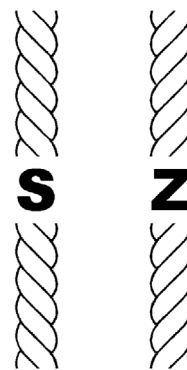
Ryc. 2. Kierunek skrętu nitki: S (lewy) i Z (prawy) (rys. E. Wtorkiewicz-Marosik)

Fig. 1. Tabby weave (drawn by E. Wtorkiewicz-Marosik)