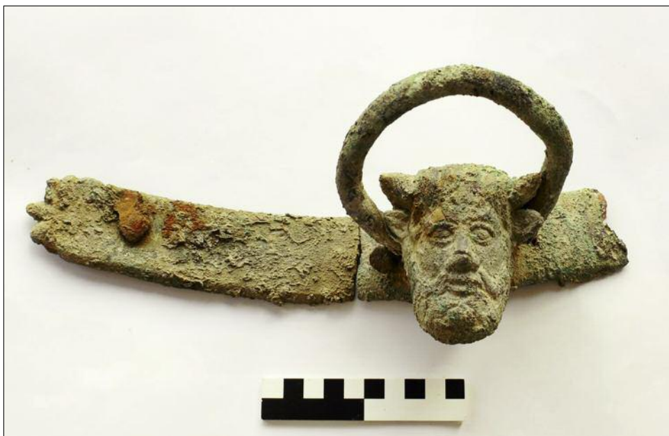
Fig. 8. Handle 2 with a fragment of the attached strap. Ryc. 8. Uchwyt 2 z fragmentem mocowania.

The second handle shares the general proportions of the ring (1.8 cm thick, 11.2 cm diameter) and the Achelous head (9.0 cm high, 8.0 cm wide), but differs in a number of aspects, most importantly its better state of preservation. While the face of the river god is more elongated and intact, except for a small piece of bronze missing above the right eye, the features are slightly less refined, possibly owing to the somewhat thicker bronze sheet. In this case, the attaching strap of bronze (13.4 cm long, 4.5 cm high, and 0.6 cm thick with a bronze nail close to the right