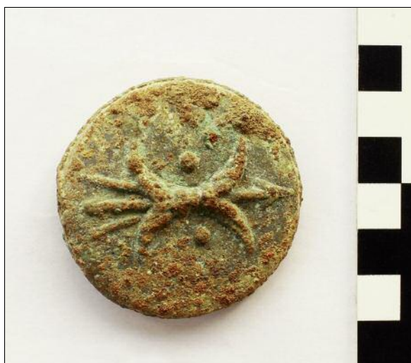
Fig. 5. Aes grave triens.

Ryc. 5. Aes grave triens.