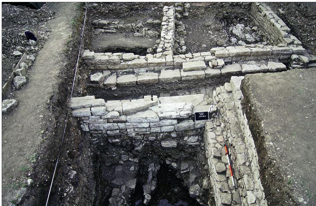
Fig. 2. Monumental wall and a threshold ('palace') at Carine VIII.

Ryc. 2. Monumentalny mur i próg („pałac”) na Carine VIII.