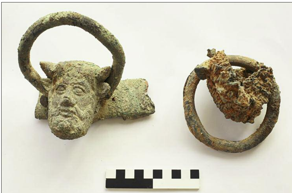
Fig. 7. Cauldron handles with depiction of Achelous.

The first handle consists of a solid but somewhat irregular bronze ring 1.2 to 1.4 cm thick, with a diameter of 10.8 to 11.1 cm, attached to a mounting hardly preserved on the backside and adorned with a head of Achelous at the front (ca. 8.6 cm high and 8.9 cm wide). While the ring is massive, the bronze sheet for the head is very thin (0.2 cm) and damaged. A large piece of the forehead including the left ear is missing and the whole object has been severely affected by oxidation. In spite of its state, it can be observed that this depiction of Achelous bears finer features than the better-preserved Handle 2. The backside of the mounting is also damaged; the attaching brace with nail holes is missing.