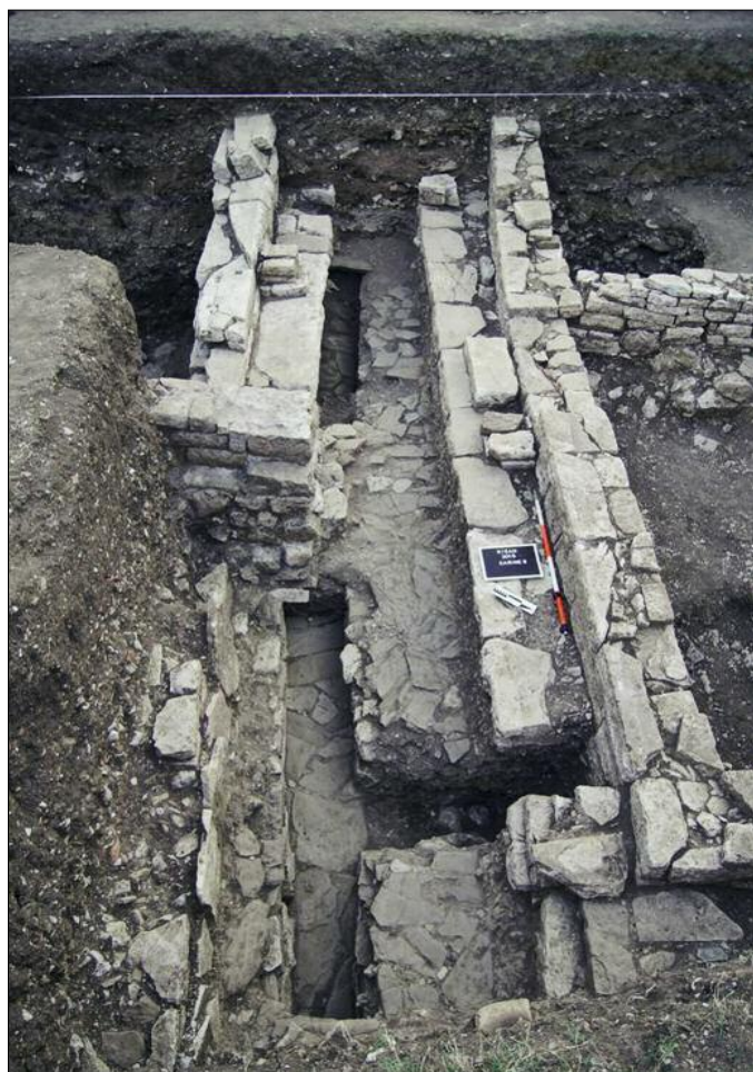
Fig. 3. Illyrian or early Hellenistic cobbled street.

Ryc. 2. Monumentalny mur i próg („pałac”) na Carine VIII.