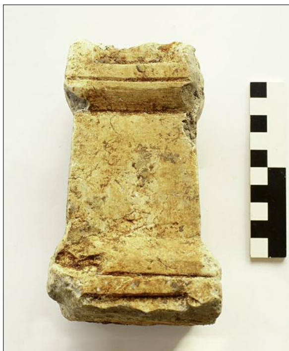
Fig. 4. Portable altar.

An impressive number of high quality artefacts reflects the sophisticated nature of the principal building. These include remains of a bronze vessel, a small portable altar made of lime paste or mortar (Fig. 4), an aes grave triens (Fig. 5), which is quite rare in this area, a gem depicting Zeus with an eagle (Fig. 6), probably from a signet ring,