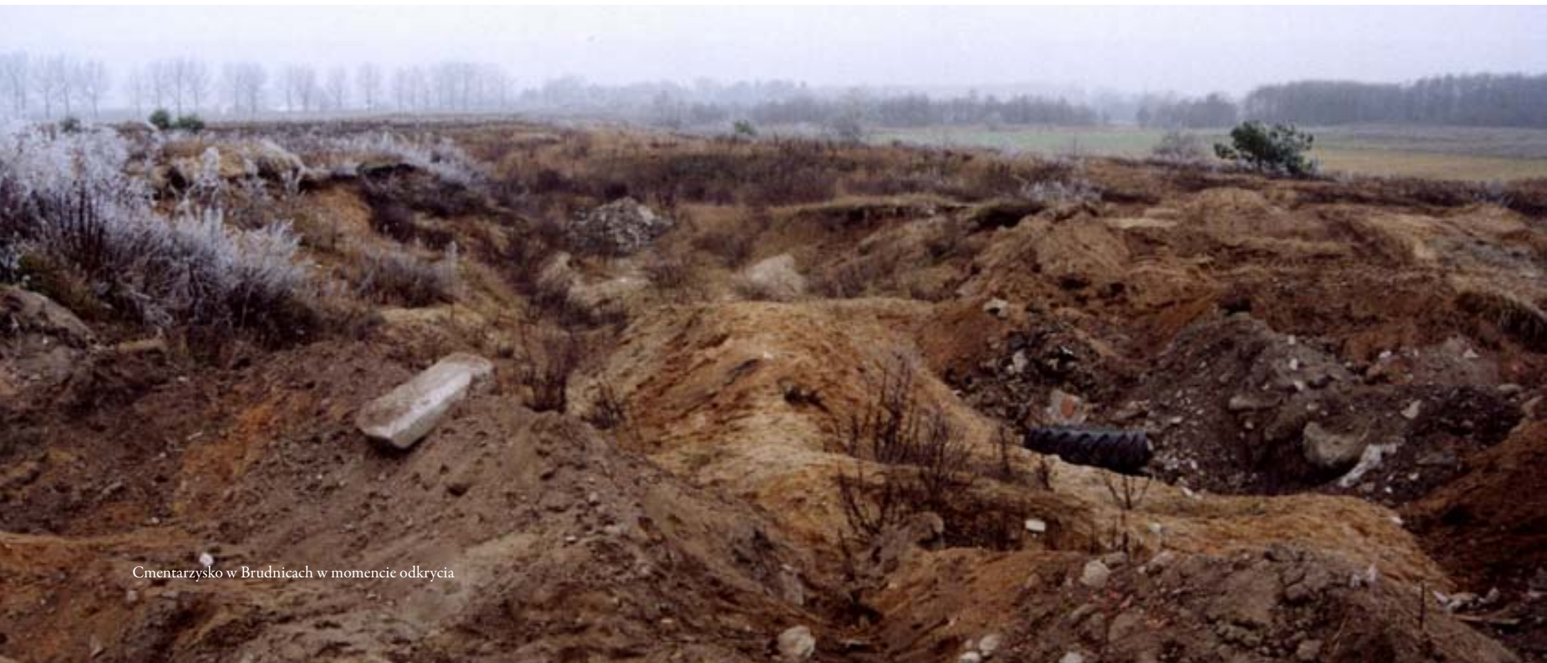
Cmentarzysko w Brudnicach w momencie odkrycia

Na wszystkich opisanych stanowiskach dominującym obrządkiem pogrzebowym było ciałopalenie (kremacja). Osoby zmarłe składane były na dużym stosie i palone, a następnie, po spaleniu ich szczątki starannie zbierano i składano do przygotowanego wcześniej grobu wykopanego w ziemi. W zależności od preferencji, a może od wieku czy pozycji społecznej zmarłej osoby, mogły one być złożone bezpośrednio do jamy grobowej, bądź do specjalnego naczynia urny. Urną mogło być