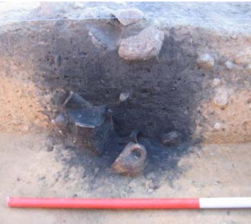
Grób ciałopalny; Zabytki z cmentarzyska w Brudnicach: szpila do spinania włosów, zapinki do spinania szat, klamerka esowata, grzebień kościany, wisior opasany, paciorek szklany z przedstawieniem twarzy - import z terenu Imperium Romanum

Osoby z wyższych warstw społecznych składane były z reguły nie spalone, w specjalnie przygotowanych komorach grobowych, jak miało to miejsce w Zgliczynie-Pobodzym. Groby takie były dodatkowo wyposażane w liczne ozdoby i importowane z terenu Imperium Rzymskiego naczynia wykonane ze szkła czy brązu. Groby szkieletowe