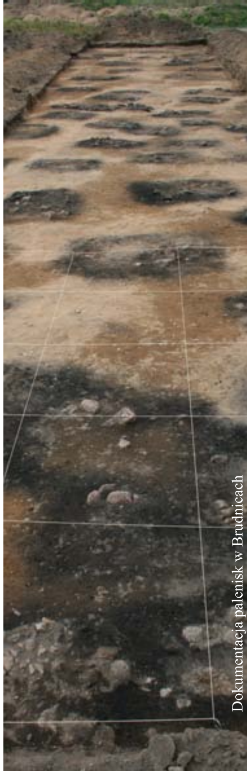
Dokumentacja palenisk w Brudnicach

Analogiczne paleniska, choć odsłaniane w znacznie mniejszej ilości odkryte zostały na pobliskich nekropoliach w Kuczorku i Zgliczynie Pobodzymb pow. żuromiński oraz w Kitkach i Dzierzgowie pow. mławski.