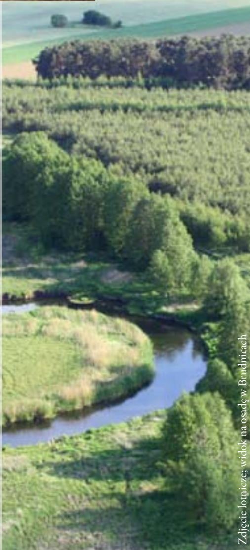
Zdjęcie lotnicze; widok na osadę w Brudnicach

które wydatowano na pierwszy wiek naszej ery. Dodatkowym argumentem do podjęcia prac badawczych był fakt, że stanowisko odkryte zostało na terenie olbrzymiej żwirowni, która funkcjonując zapewne już od lat sześćdziesiątych dwudziestego wieku, spowodowała olbrzymie zniszczenie nekropoli. Kolejnym bodźcem był fakt, że nie tylko ziemia żuromińska, ale teren od Mławy na wschodzie do Drwęcy na zachodzie, był białą plamą na archeologicznej mapie Polski. Fakt ten tłumaczony był często pasem wzajemnej trwogi, jaki w czasach starożytnych występować miał pomiędzy niektórymi wielkimi ludami.