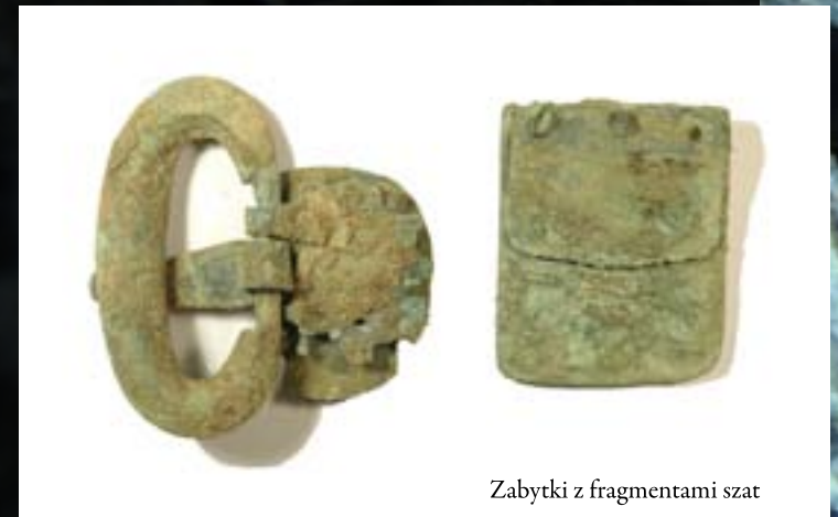
Zabytki z fragmentami szat

Strategiczne położenie stanowisk w Kuczborku, Siemiątkowie i Zgliczynie Pobodzym, a zwłaszcza cmentarzyska w Brudnicach, powodują, że nasze dotychczasowe wyobrażenie o tej części Mazowsza musi ulec zmianie. Dzięki prowadzonym pracom badawczym obszar ten