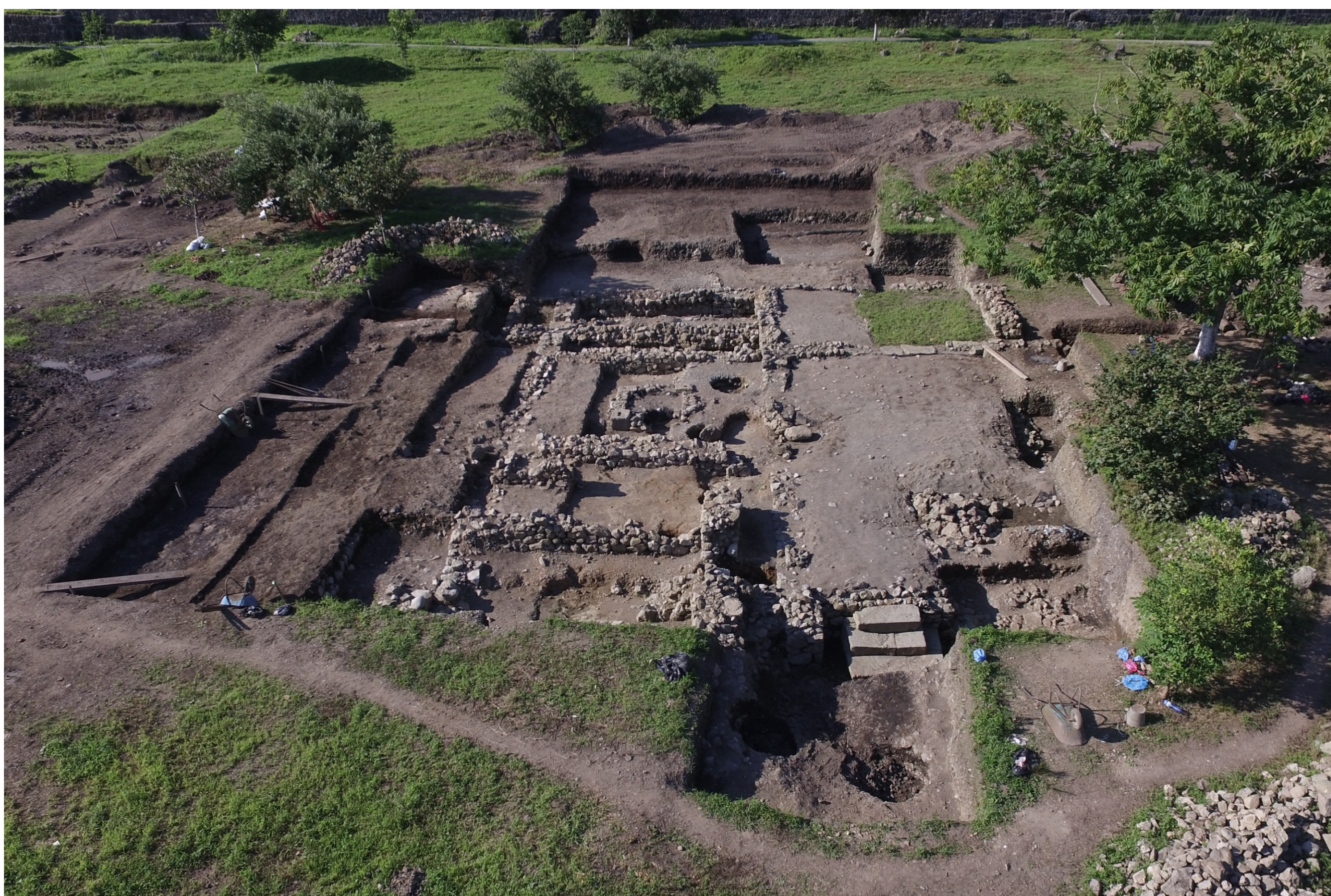
Powyżej: Zdjęcie wykopu z widocznymi zabudowaniami budynku komendantury obozu legionowego

Ścianki pucharaków były ozdobione czterema kolumnami, pomiędzy którymi