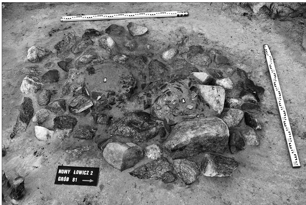
Ryc. 2. Bruk kamienny z grobami popielnicowymi kultury łużyckiej (Ł81A i Ł81B).

Pochówki kultury wielbarskiej z płaskiej części nekropoli reprezentowane były przez 14 grobów ciałopalnych jamowych, 2 popielnicowe oraz 5 pochówków inhumacyjnych, o stosunkowo małej długości jamy. W sumie podczas prac wykopaliskowych w latach 2011–2014 zaobserwowano aż 13 grobów tego ostatniego typu, dlatego warto poświęcić im nieco więcej uwagi. Osiem z nich wystąpiło w wyraźnej koncentracji pomiędzy kurhanami 8, 11 i 12 (gr. 158, 159, 160, 161, 162, 163, 167, 172; por. CIEŚLIŃSKI, KASPRZAK, STASIAK 2016: ryc. 2), natomiast groby odsłonięte w 2013 i 2014 r. zlokalizowane były pomiędzy kurhanami 10 i 12 (gr. 174, 177, 181, 185, 190). Cechą wspólną tej grupy pochówków, jak już zauważono powyżej, była niewielka długość jam grobowych, wynosząca w stropie średnio ok. 1,3 m, i tylko sporadycznie dochodząca do 1,6–1,7 m (gr. 160 i 172). Wszystkie jamy charakteryzował wydłużony, owalny kształt i usytuowanie dłuższej osi na linii N-S, w niektórych przypadkach z kilkustopniowym